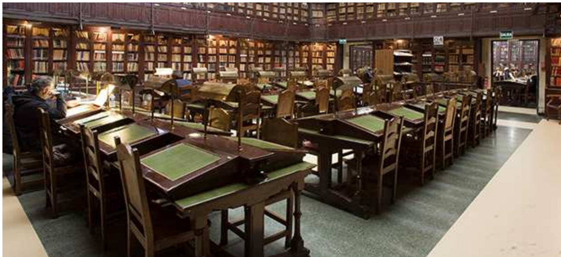
Ateneo de Madrid